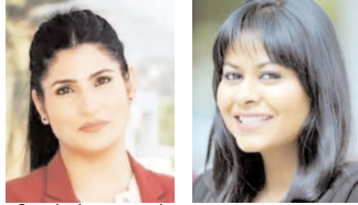
महिलाओं को सशक्त बनाने का कार्य कर रही है।

इन्दौर। ज्वाला संस्था के स्थापना दिवस के अवसर पर हर साल नारी तृ नारायणी कार्यक्रम का आयोजन किया जाता है।