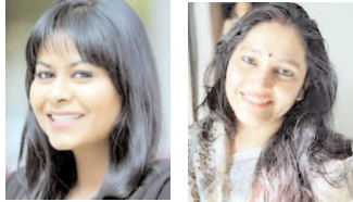
से 7 बजे तक डेली कॉलेज के धीरूभाई अंबानी ऑडिटोरियम में होने वाले इस कार्यक्रम में 6 कैटेगरी (सोर्टर्स, लॉ, साइंस, एग्रीकल्चर, लिटरेचर, मीडिया) में उन महिलाओं को सम्मानित किया जाएगा, जिनसे दूसरी महिलाओं